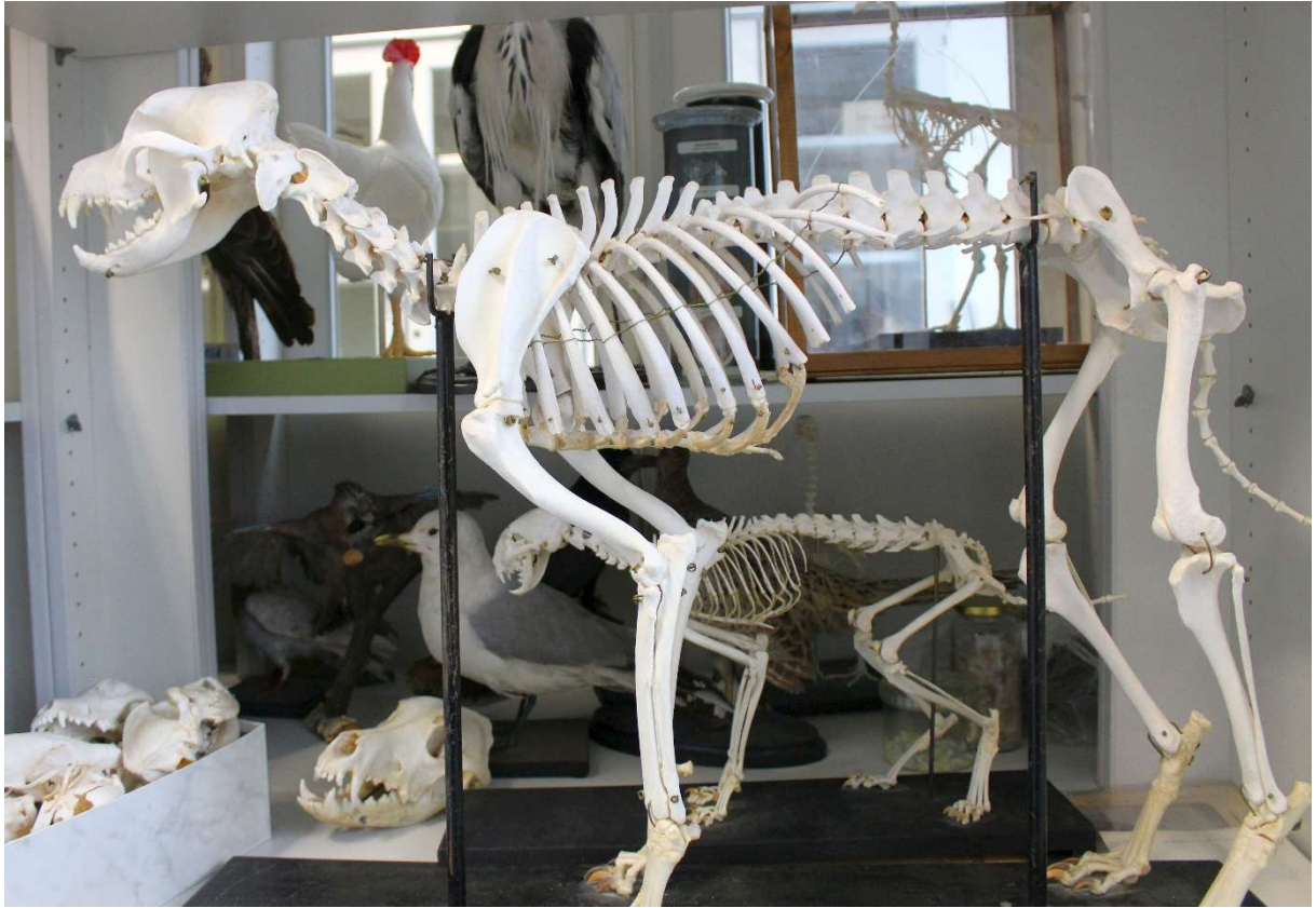
[Kirsten Bücker - Journalistikkurs 8]